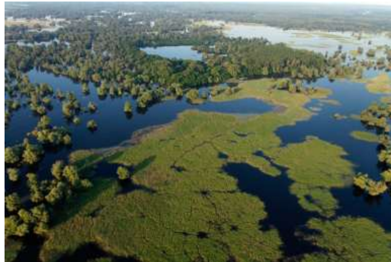
Izvor: PP Kopački rit